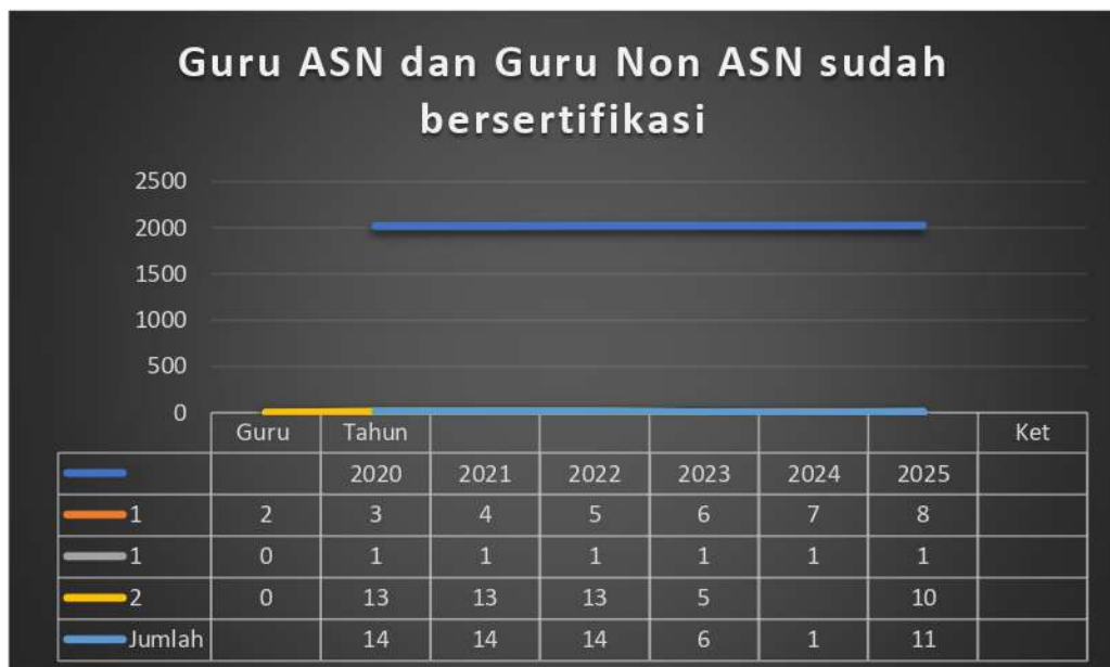
Guru PNS dan Non PNS sudah bersertifikasi Tahun 2025